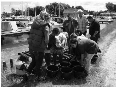
På billedes ses krabbejægerne i fuld aktion.

Krabbebanen, som vi i samarbejde med "Norsminde-for-fulde-sejl", fremstillede til alle. Børne-krabbejægere, som vi nu får besøg af hver dag, lader med glade hvin krabberne løbe vædeløb ud i friheden igen. Helt uden en smule hensyn til de lokale fiskere der synes, at der er krabber nok i deres garn i deres daglige fiskeri.